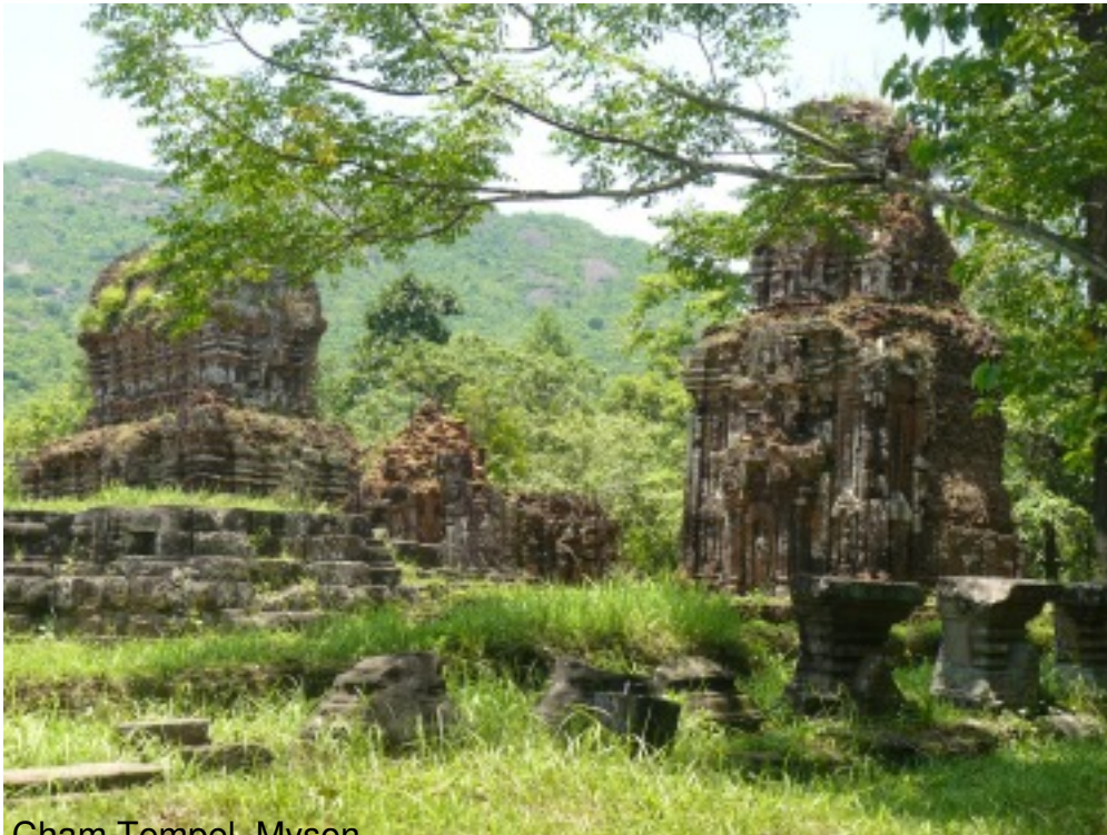
Cham Tempel - Myson