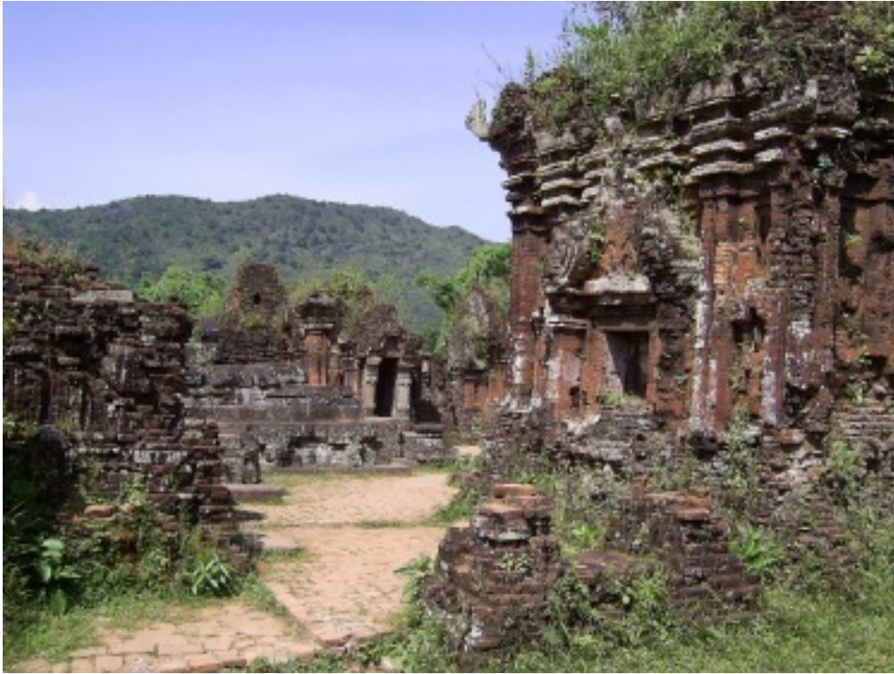
Cham Tempel, Myson.