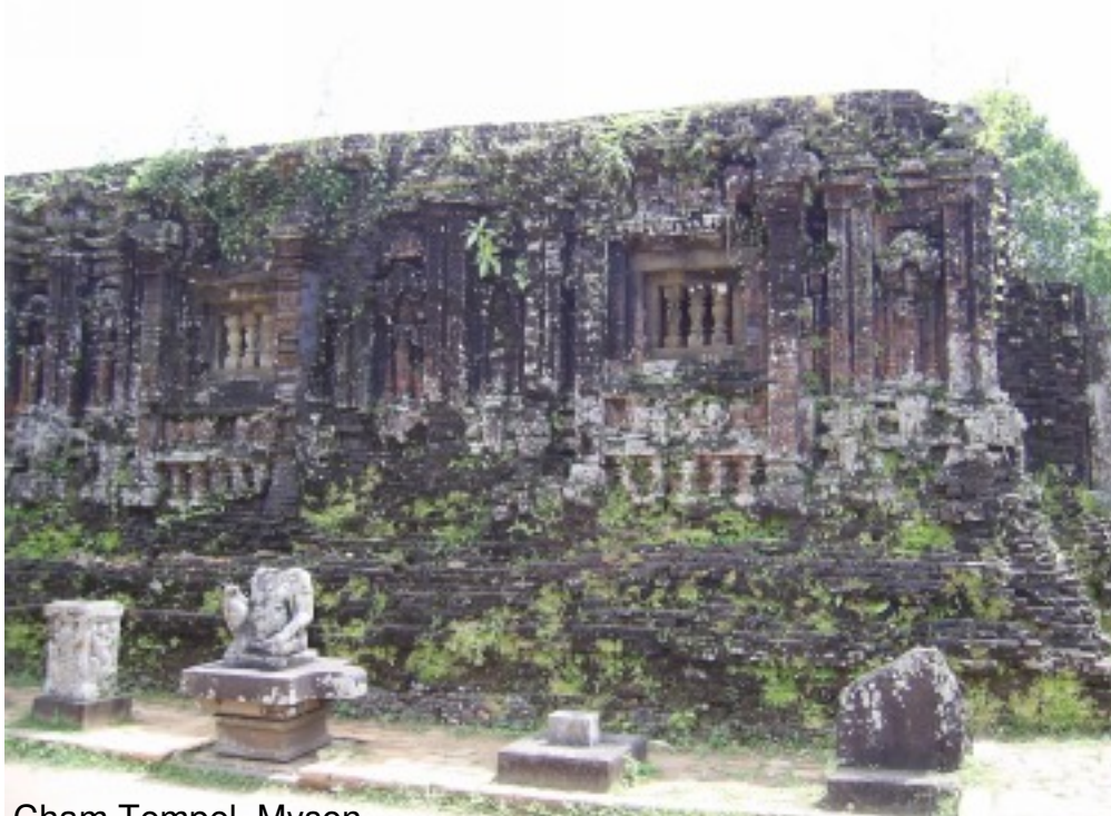
Cham Tempel, Myson.