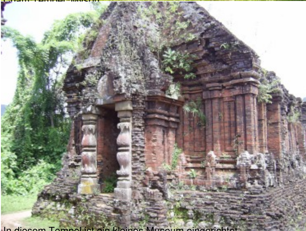
In diesem Tempel ist ein kleines Museum eingerichtet.