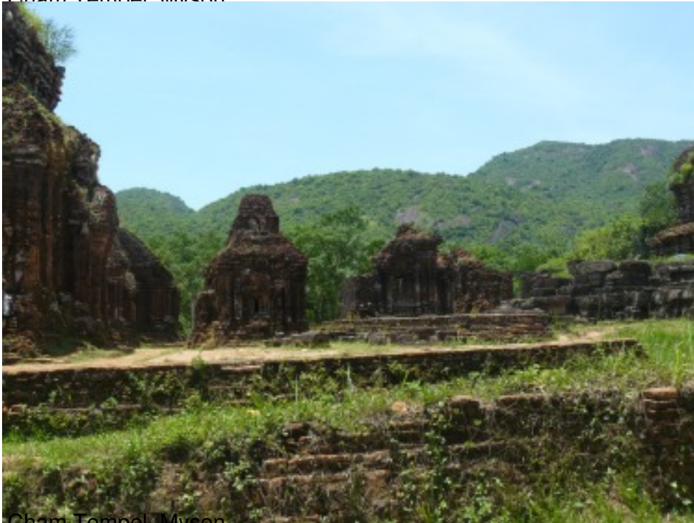
Cham Tempel, Myson.