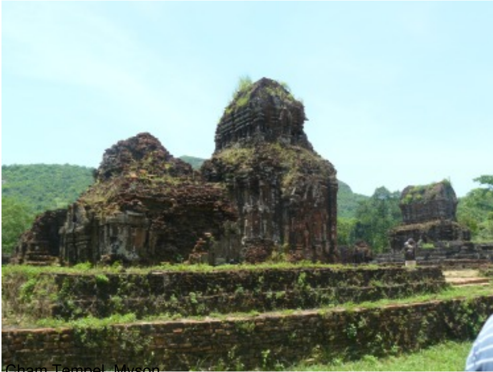
Cham Tempel, Myson