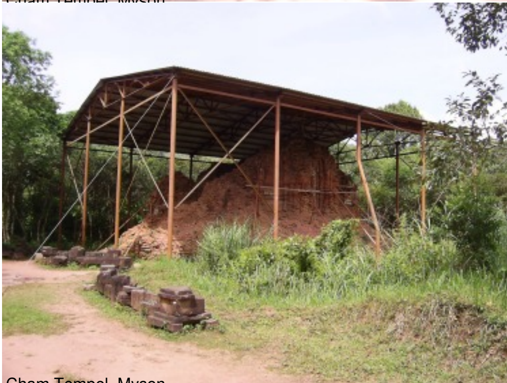
Cham Tempel, Myson.