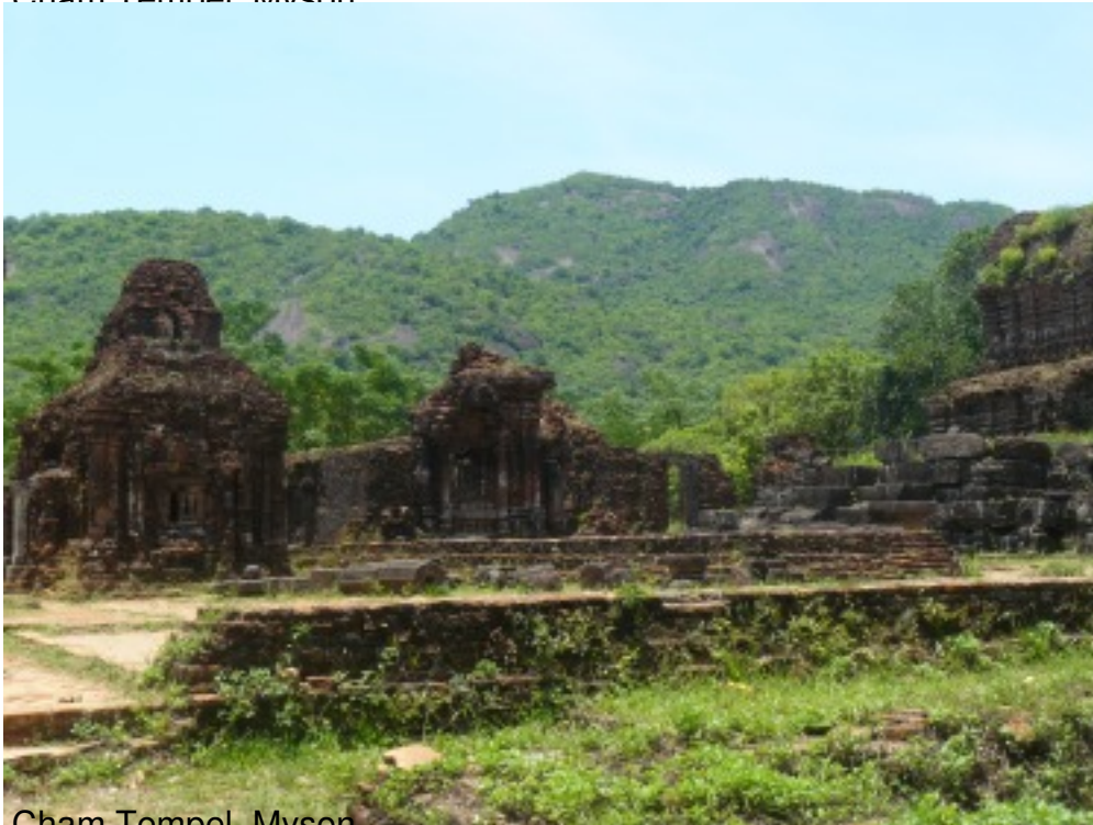
Cham Tempel, Myson.