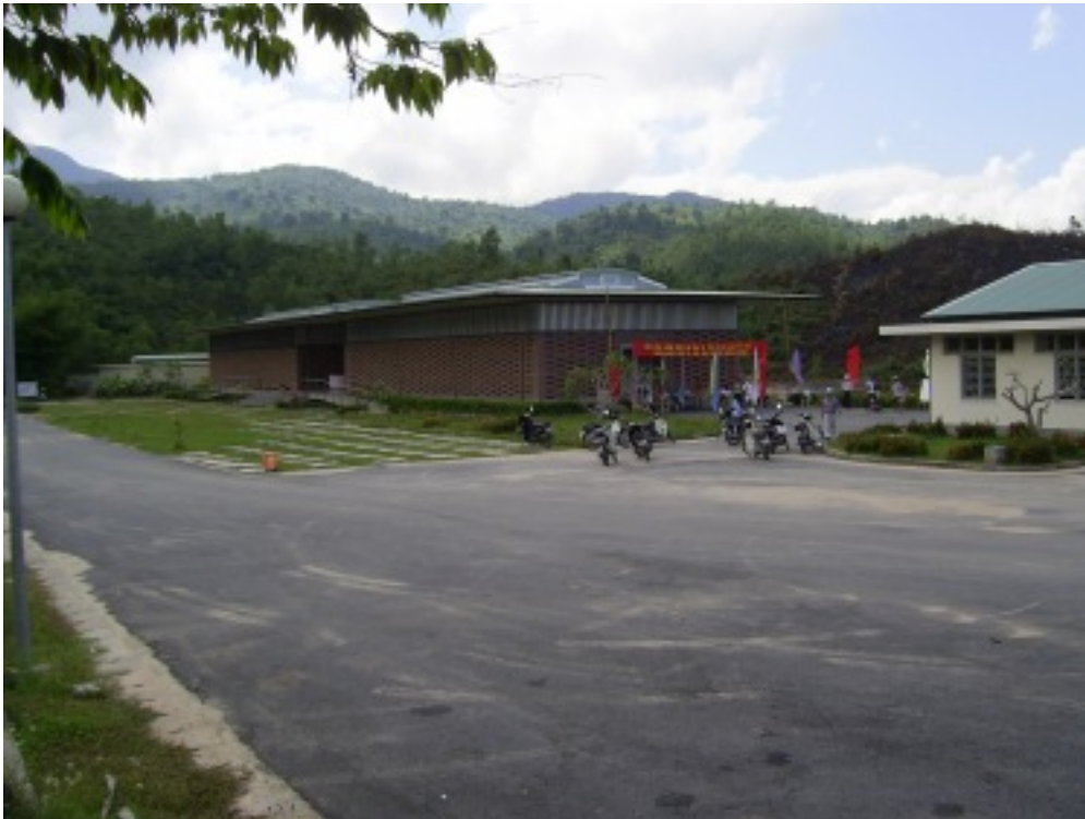
Tickethäuschen und Museum.