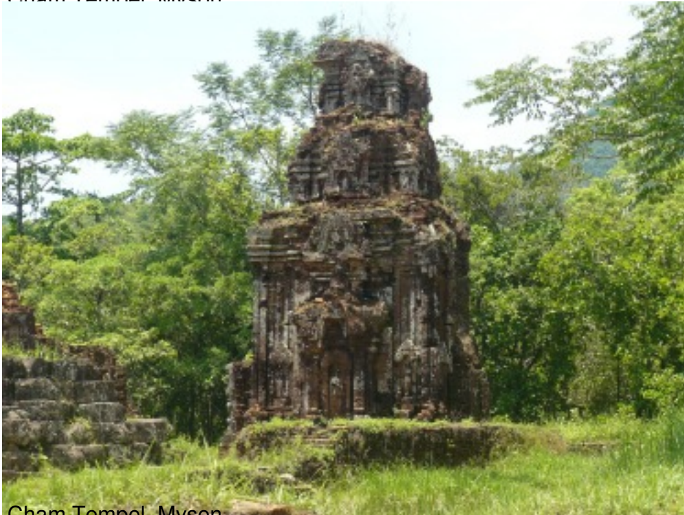
Cham Tempel, Myson.