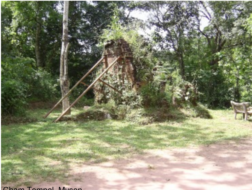
Cham Tempel - Myson