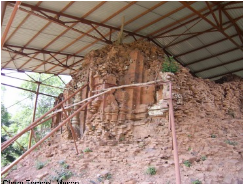
Cham Tempel - Myson