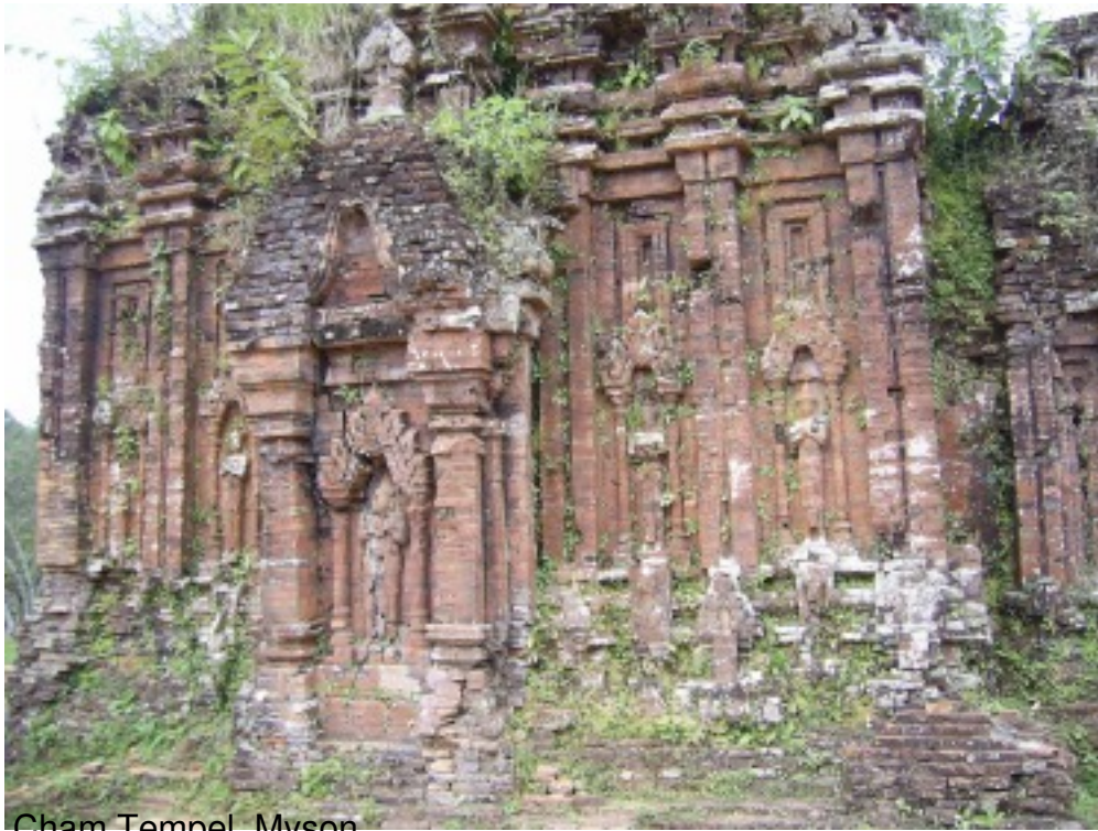
Cham Tempel - Myson