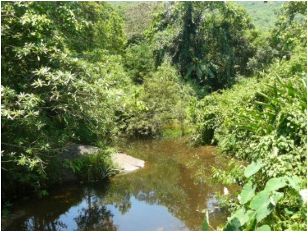
Um die Tempelanlage ist noch viel Natur.