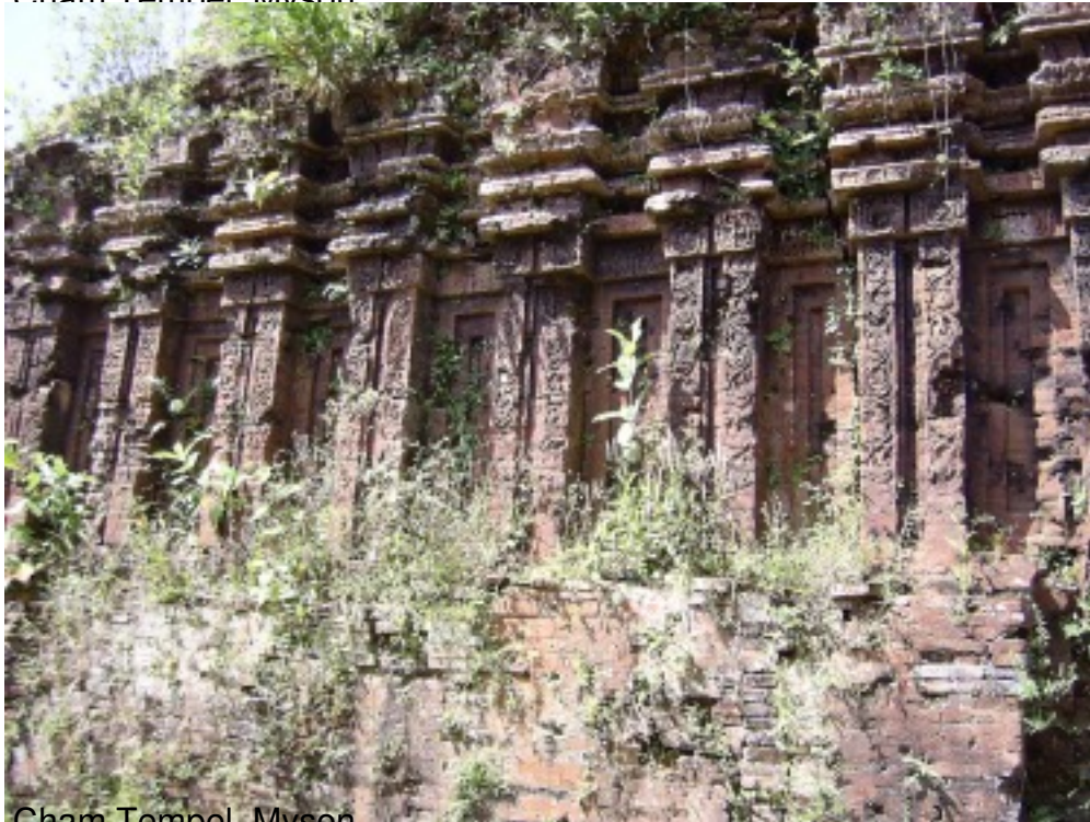
Cham Tempel, Myson.