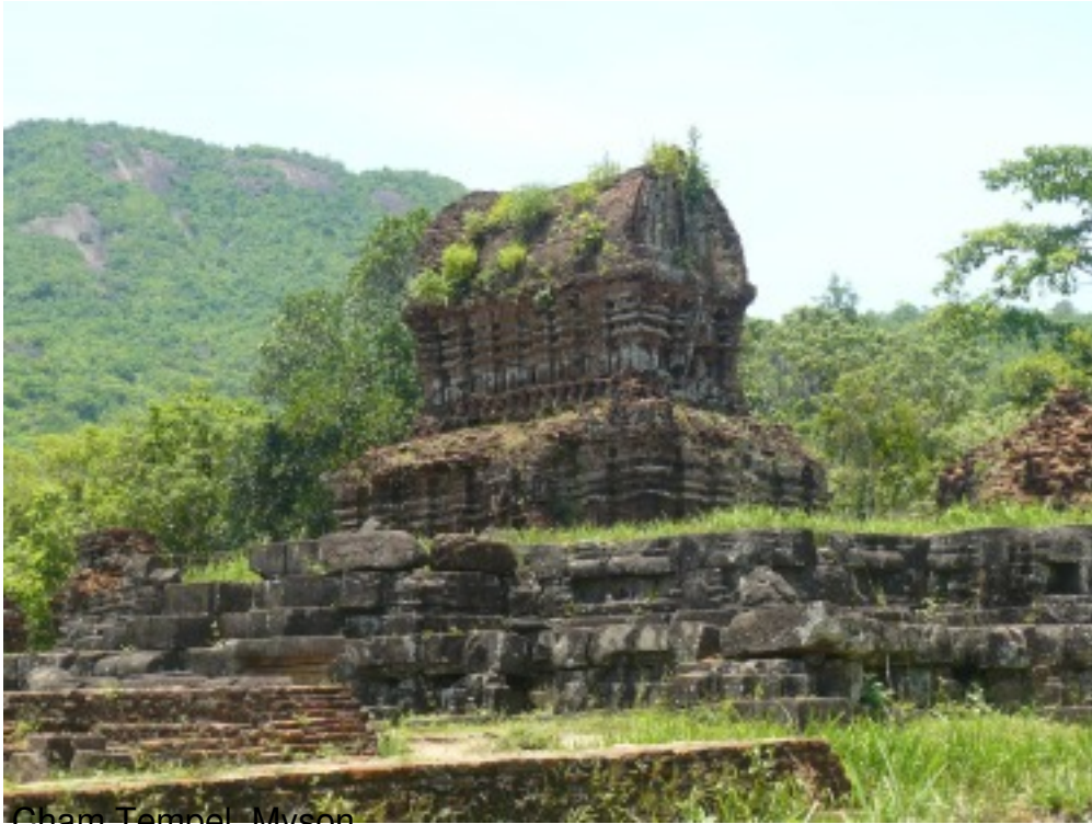
Cham Tempel, Myson