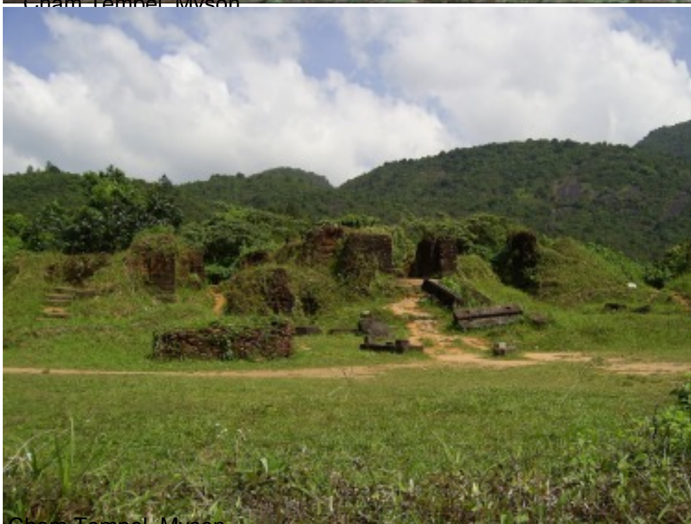
Cham Tempel, Myson.