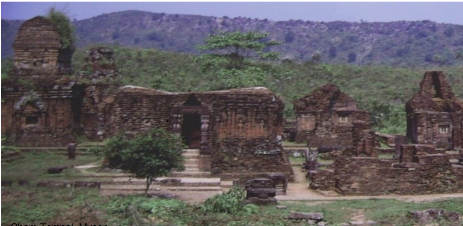
Cham Tempel, Myson