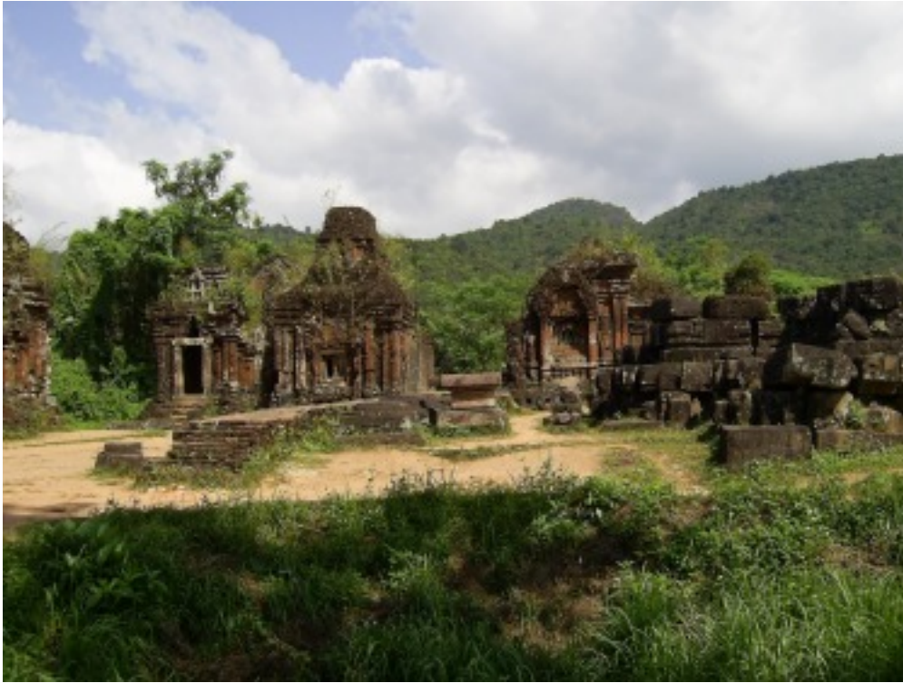
Cham Tempel, Myson.