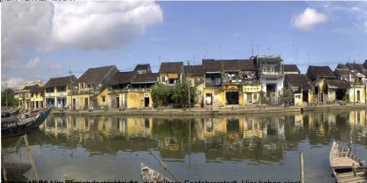
Handgezeichnet als Europäerstadt, die frühere Seefahrerstadt. Hier haben einst