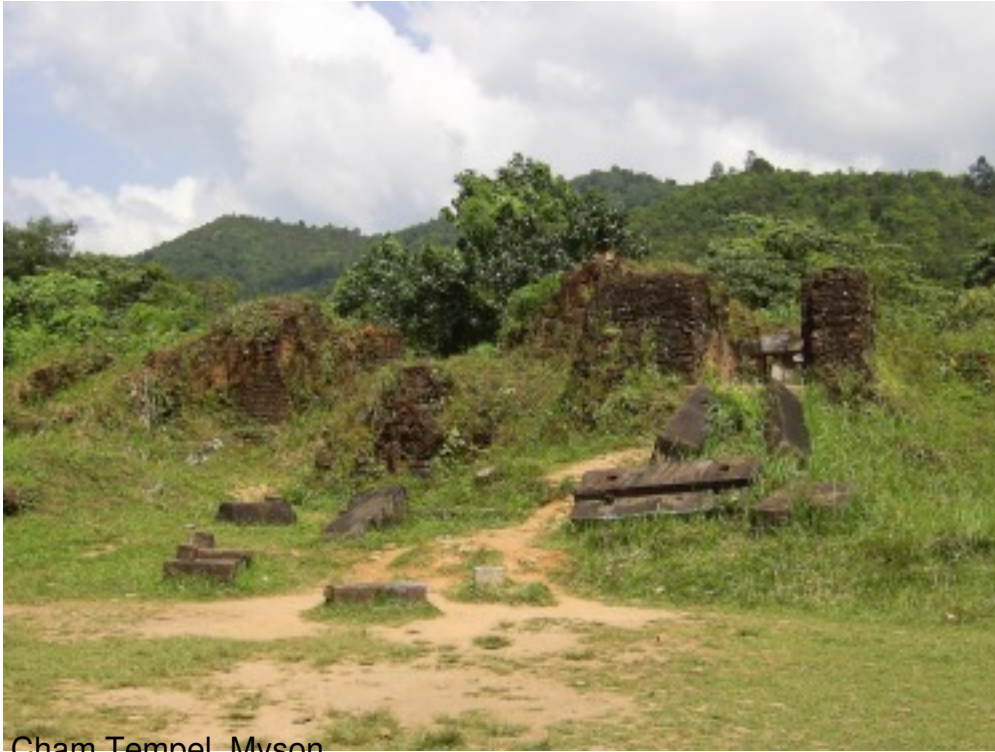
Cham Tempel, Myson