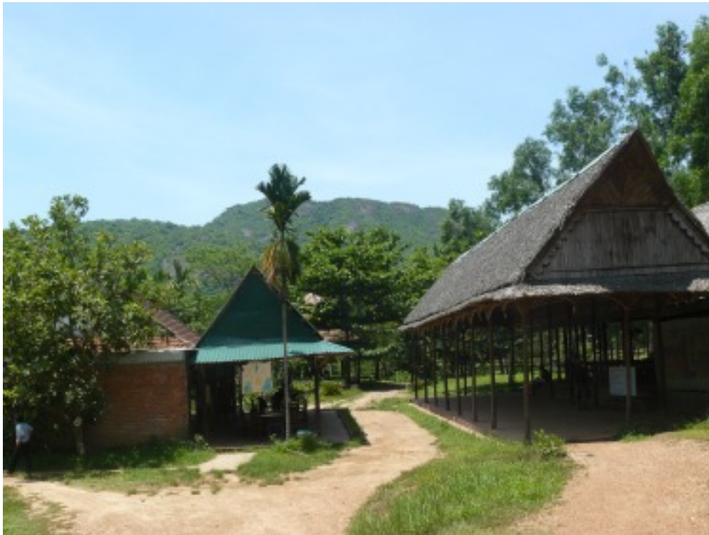
Ankunft beim Gebäude wo Tänze / Musik vorgeführt werden.