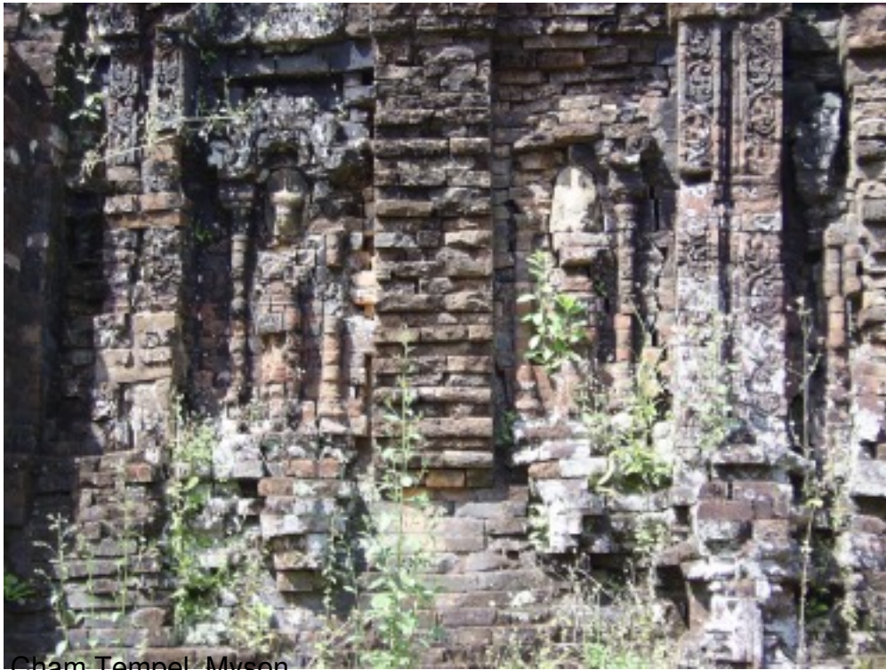
Cham Tempel Myson