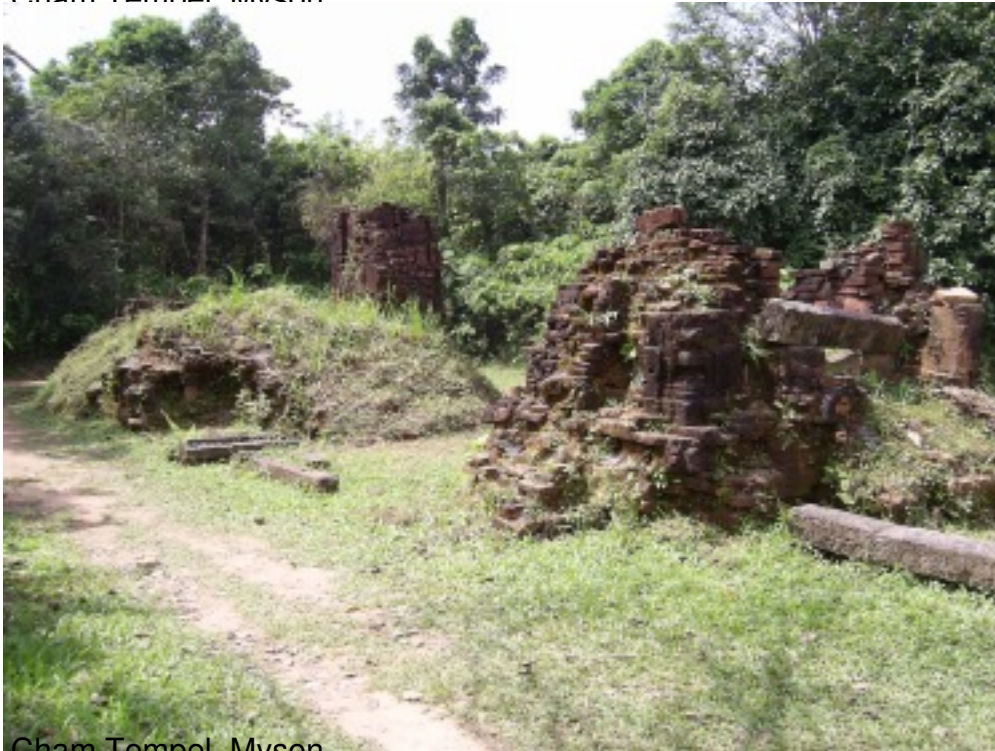
Cham Tempel, Myson.