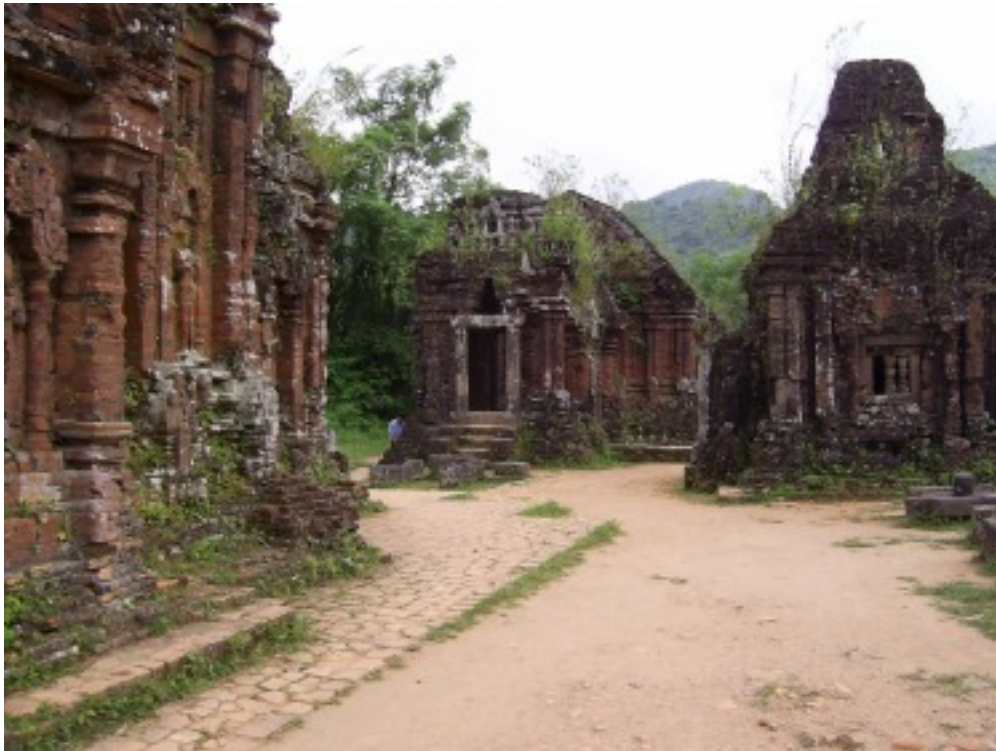
Cham Tempel, Myson.