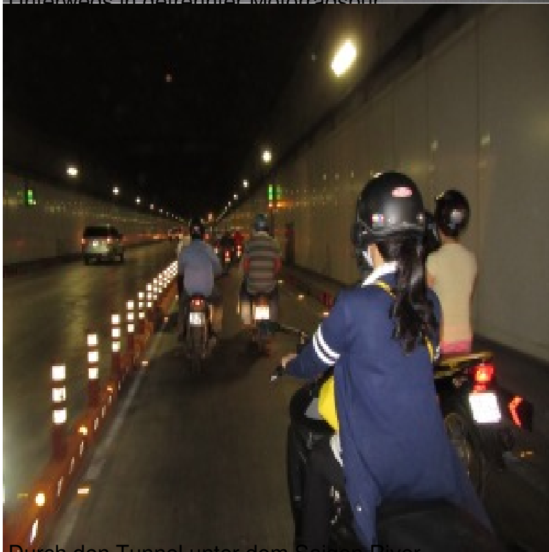
Durch den Tunnel unter dem Saigon River