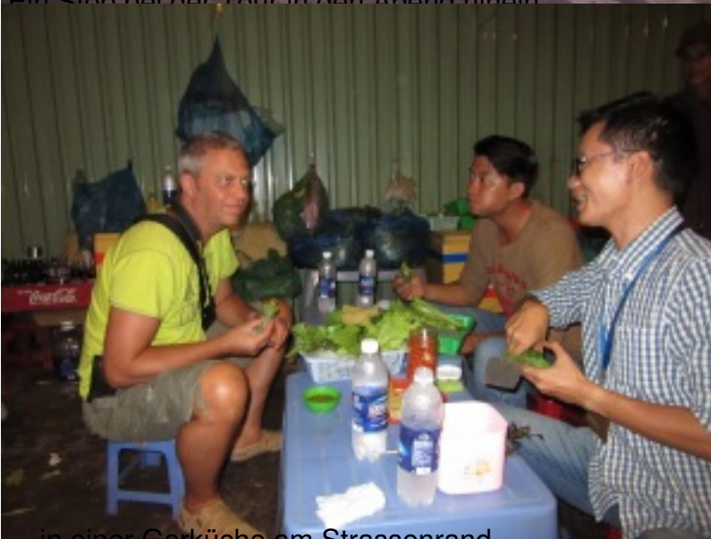
in einer Garküche am Strassenrand