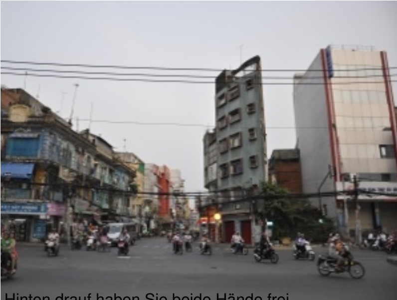
Hinten drauf haben Sie beide Hände frei