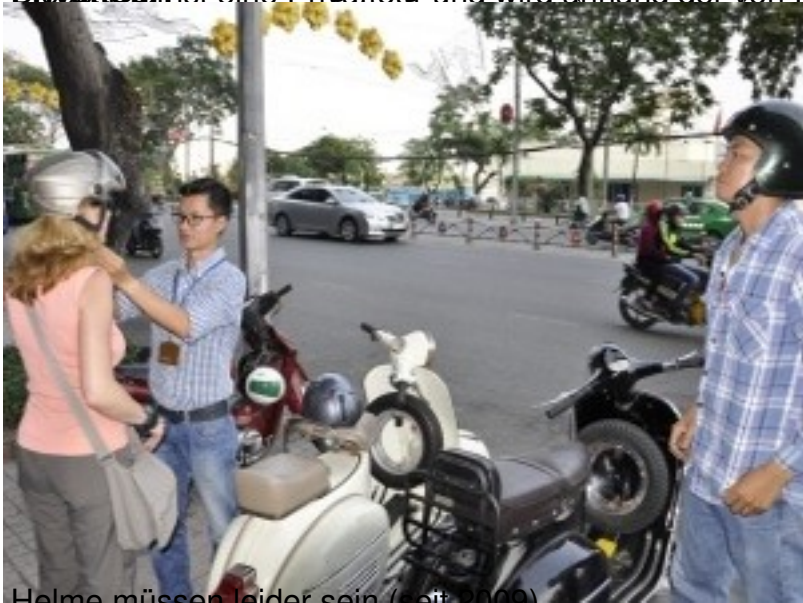
Helme müssen leider sein (seit 2009)

Preis: 150.000 VND (ca. 6,50 €) pro Person und mit Regen zu rechnen. Es wird aber ein Regenschirm mitgebracht. Der Fahrer ist ein erfahrener Fahrer und wird Sie sicher durch die Stadt bringen. Die Tour ist für 4 Tage, 2 Personen ist eine Person und wird anhand der Vorname gebuchten Teilnehmeranzahl berechnet. E