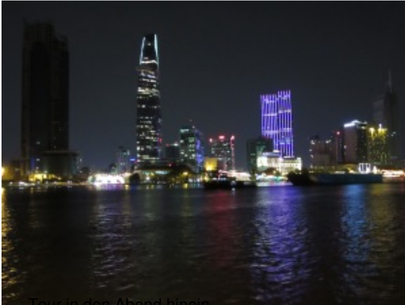
.....Tour in den Abend hinein.