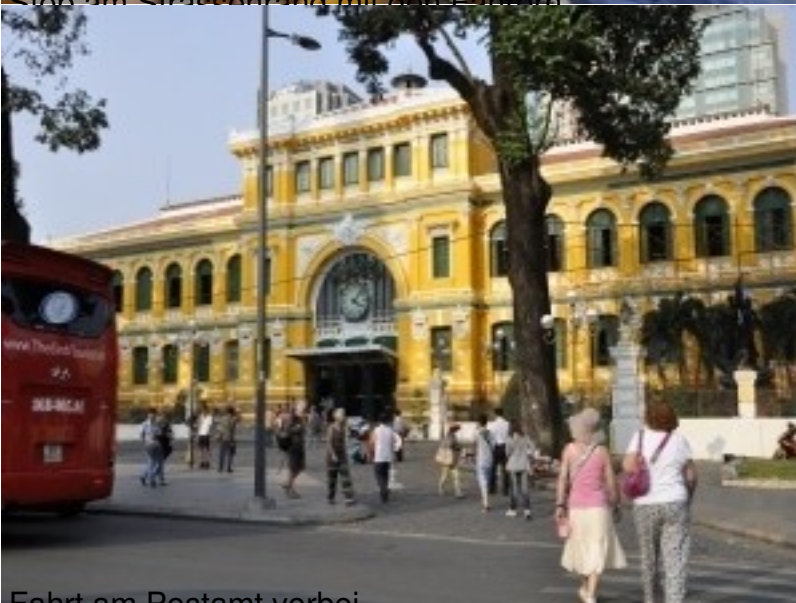
Fahrt am Postamt vorbei.