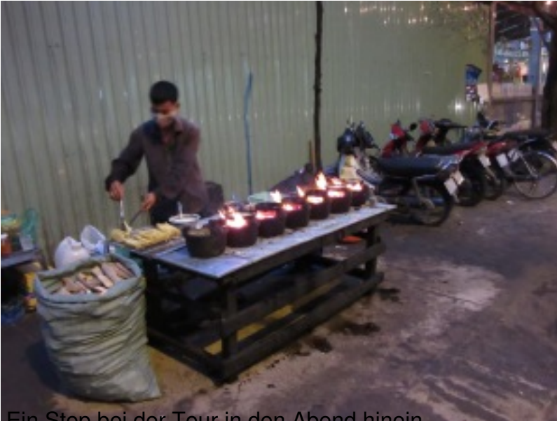
Ein Stop bei der Tour in den Abend hinein