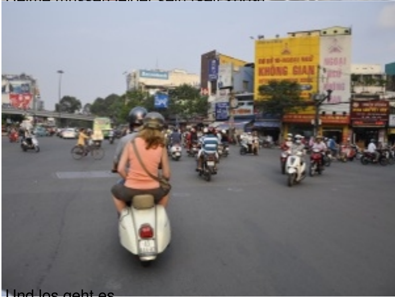
Und los geht es.