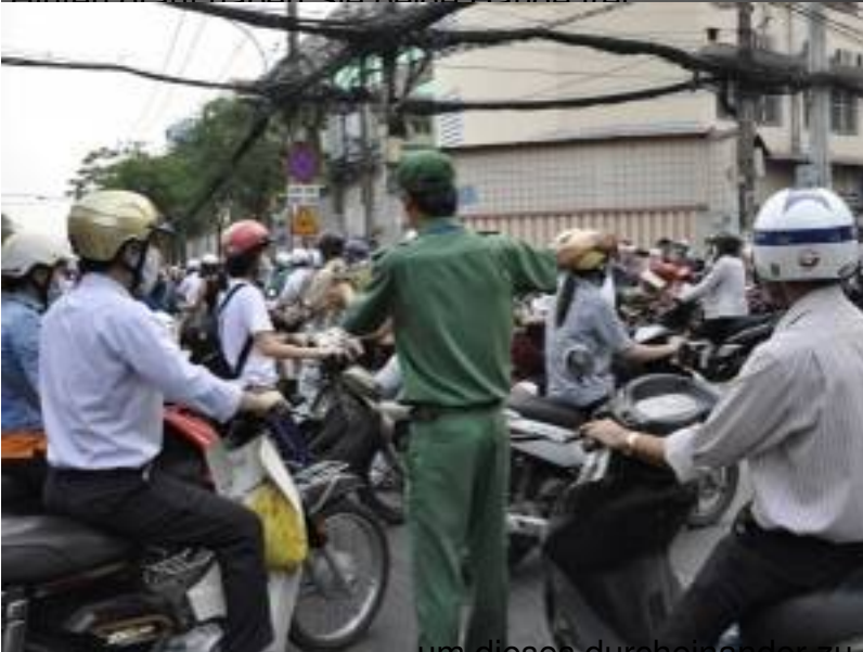
um dieses durcheinander zu knipsen.