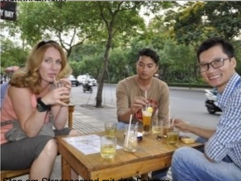
Stop am Strassenrand mit den Fahrern