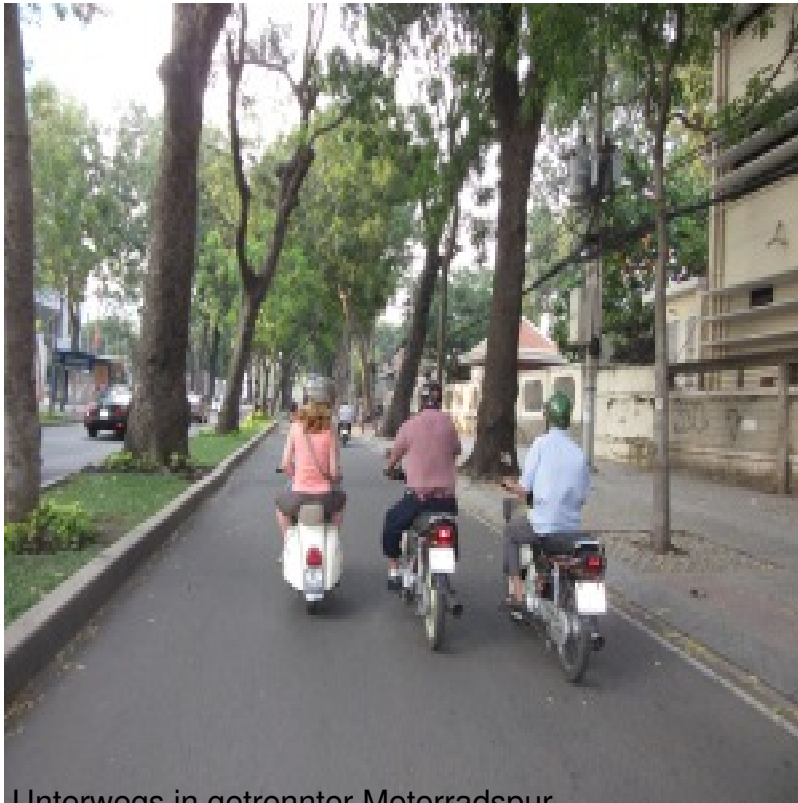
Untenwegs in getrennter Motorradspur