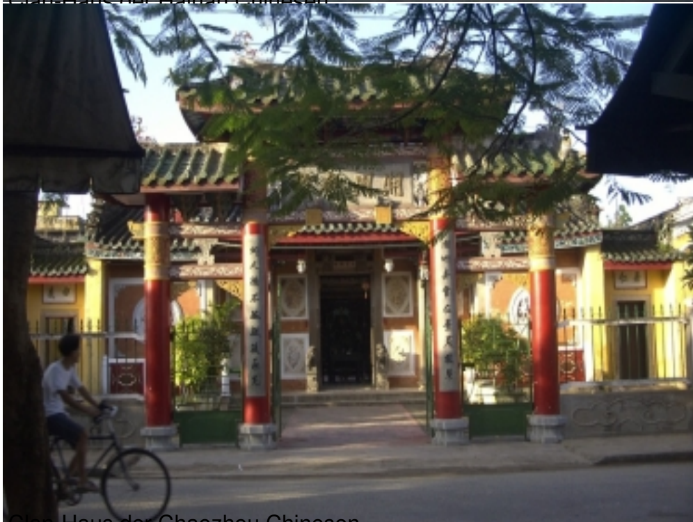
Clan-Haus der Chaozhou Chinesen