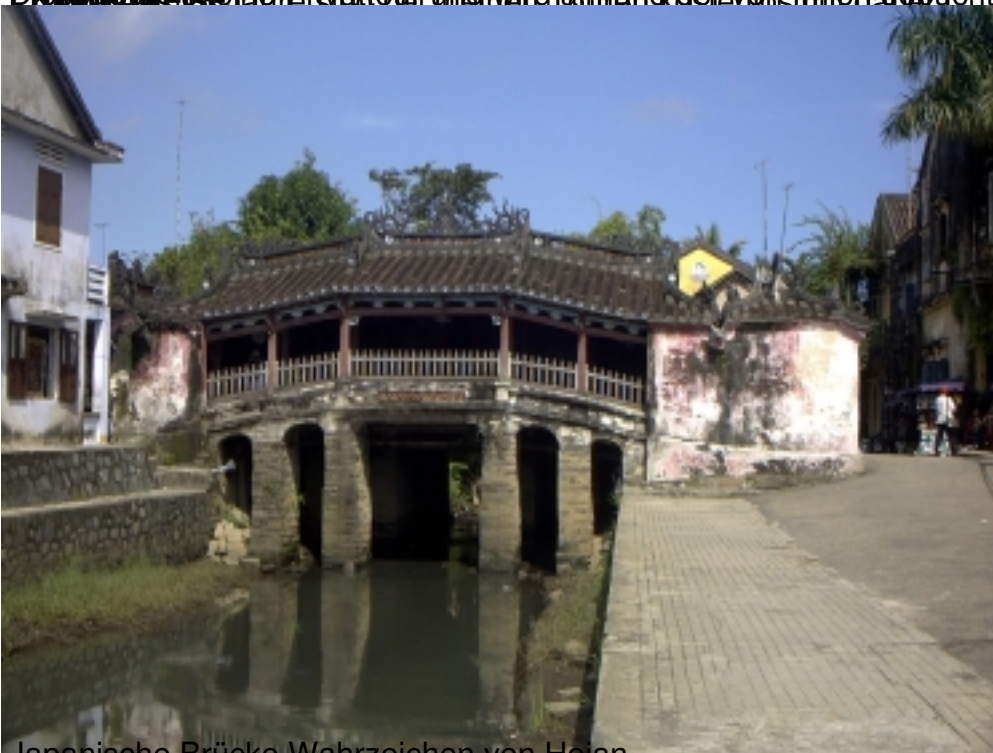
Japanische Brücke Wahrzeichen von Hoian

Der Start: 08:30 Uhr von der Gästehalle 11:30 Uhr / 13:00 Uhr in deutscher Sprache Preis: 100.000 VND pro Person (inkl. Eintrittsgeld, Stadtführung mit einem englischsprachigen Alle Preise sind in US-Dollars angegeben. Tour Code: 11VH21001 Die Preise sind in US-Dollars angegeben und werden anhand der von Ihnen gebuchten Teilnehmeranzahl berechnet. E