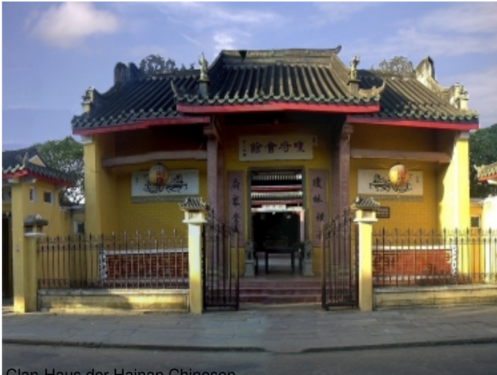
Clan-Haus der Hainan Chinesen