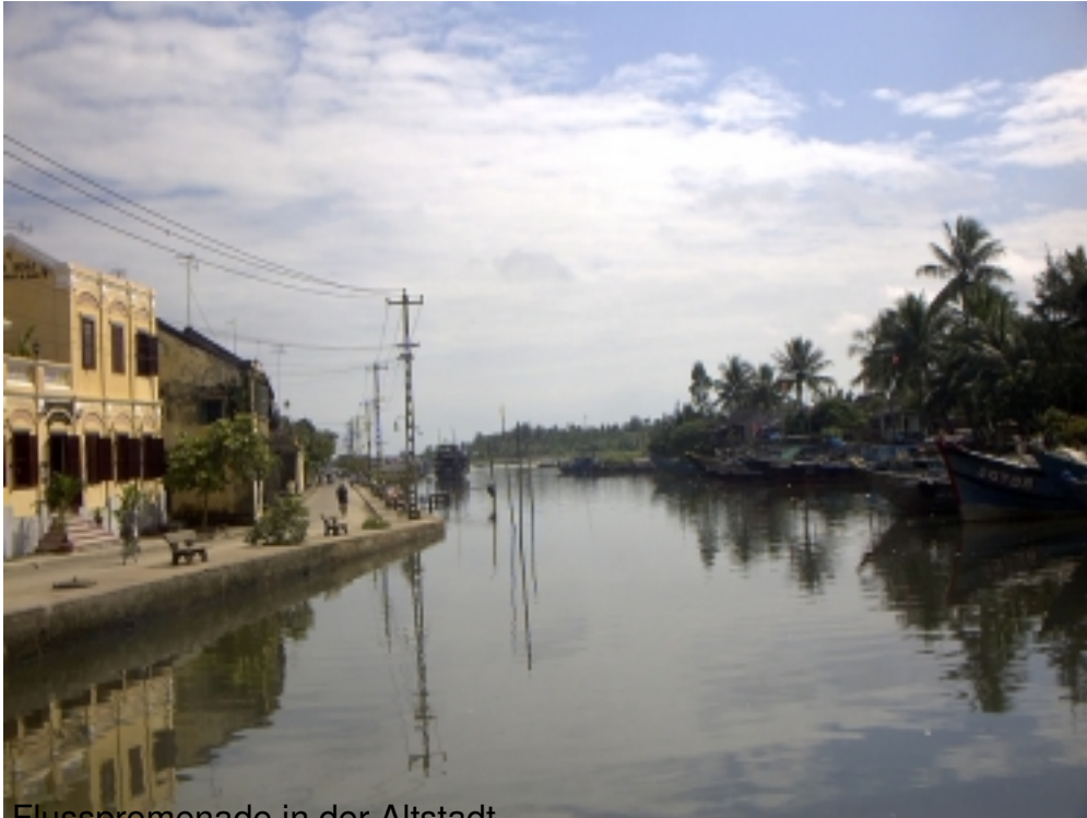
Flusspromenade in der Altstadt