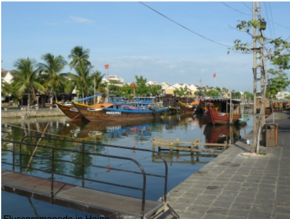
Flusspromenade in Hoian