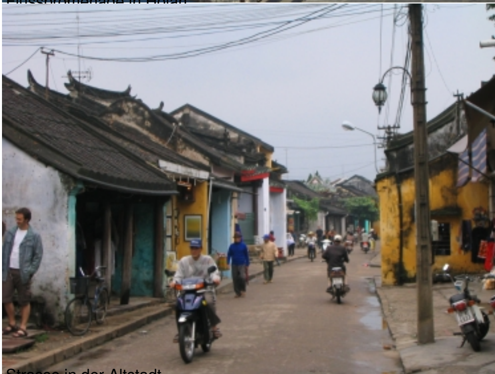
Strasse in der Altstadt.