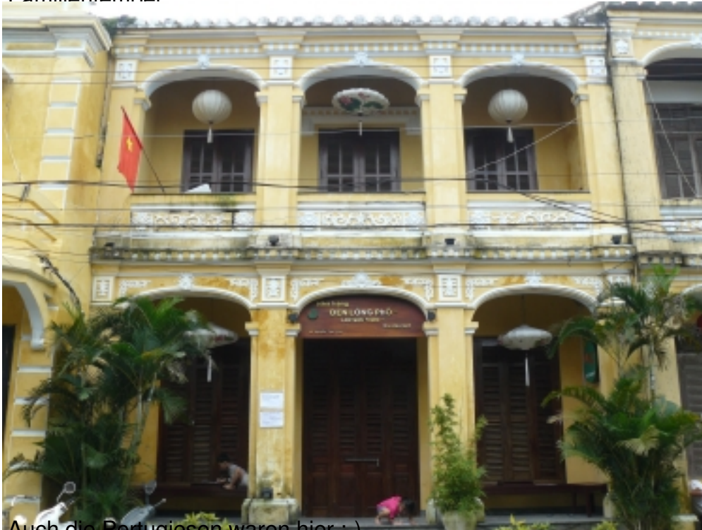
Auch die Portugiesen waren hier :-)