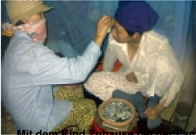
Mit dem Kind Zuhause bei der Familie

Wir sind noch mit dem Taxi unterwegs nach Hause, als wir dort schon kräftig vorbereitet sind. Hier die vielen