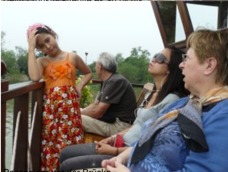
Passagiere vor der Brücke