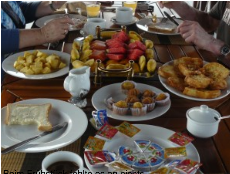
Beim Frühstück fehlte es an nichts