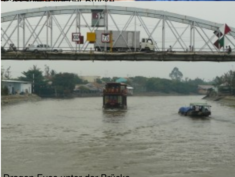
Dragon Eyes unter der Brücke