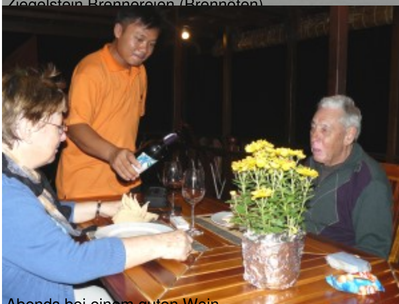
Abends bei einem guten Wein