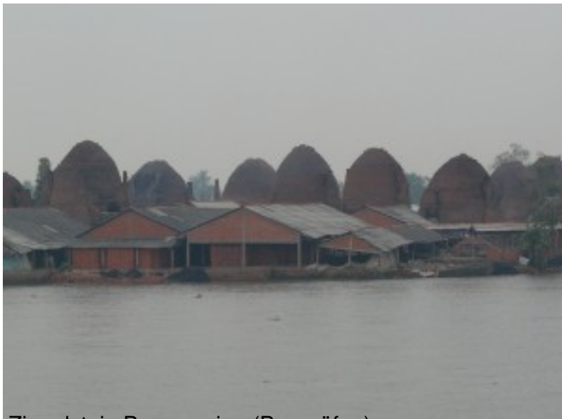
Ziegelstein Brennerien (Brennöfen)