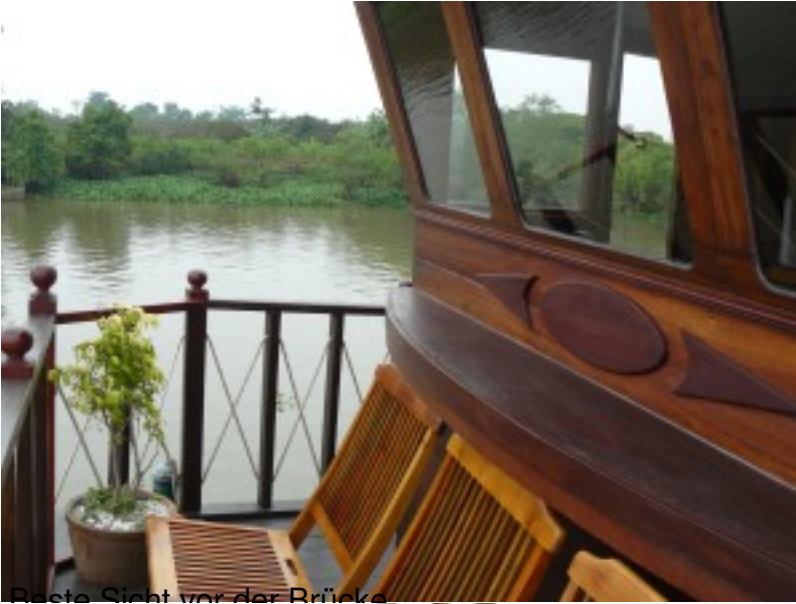
Beste Sicht vor der Brücke