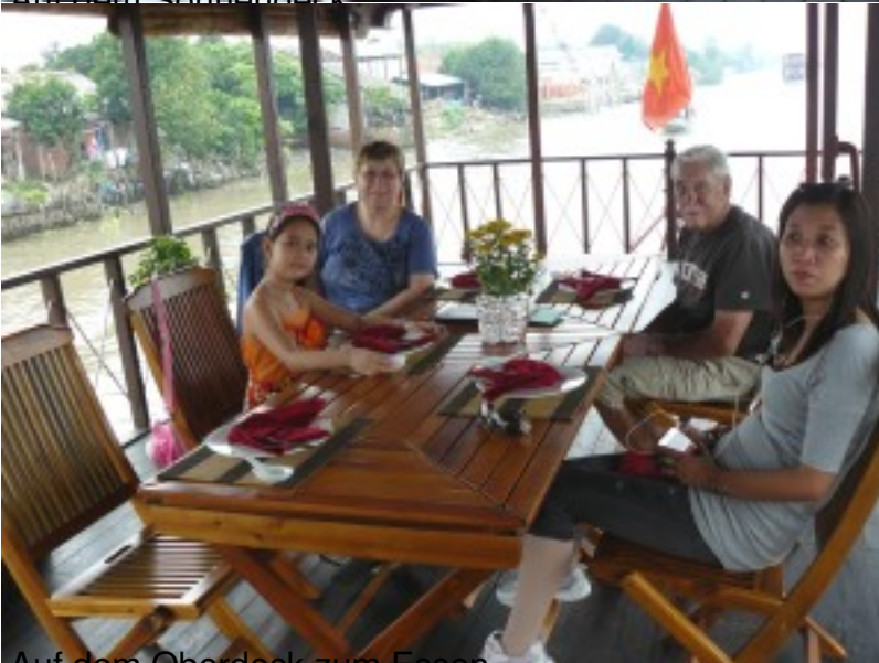
Auf dem Oberdeck zum Essen