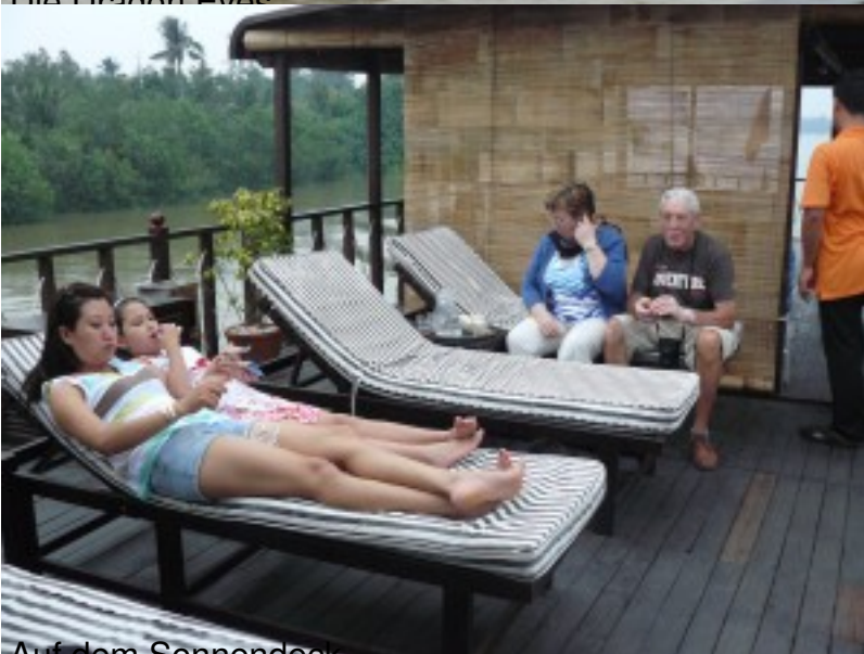
Auf dem Sonnendeck