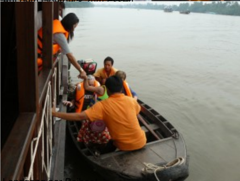
Landgang per Beiboot