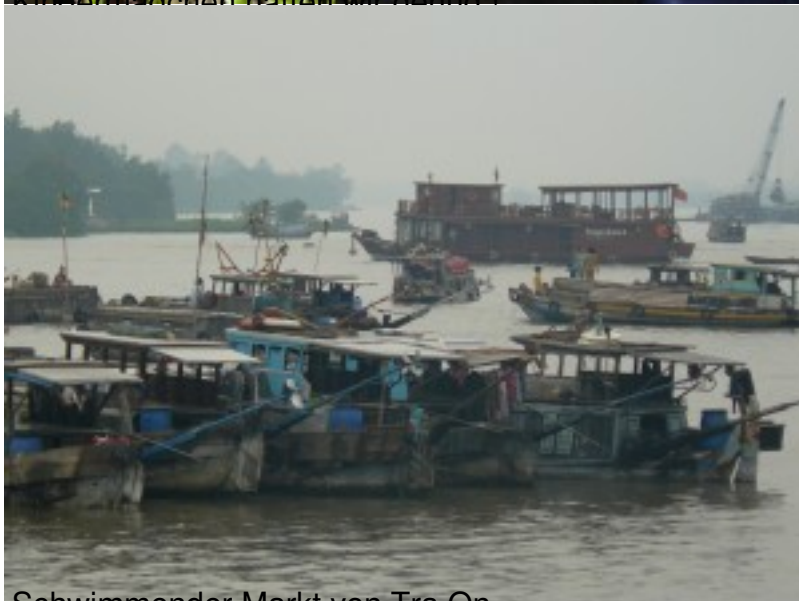
Schwimmender Markt von Tra On