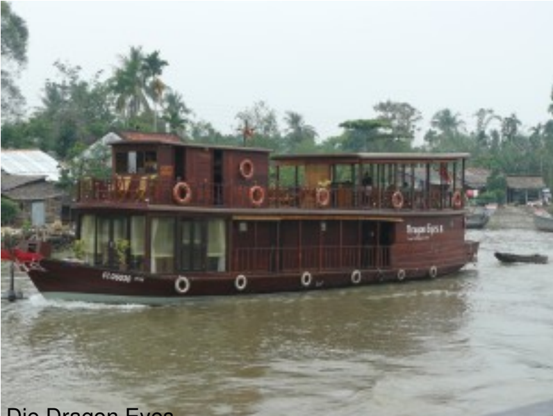
Die Dragon Eyes