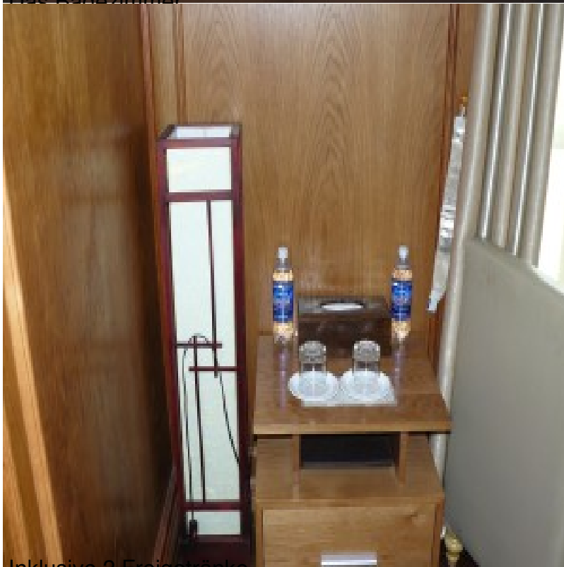
Inklusive 2 Freigetranke