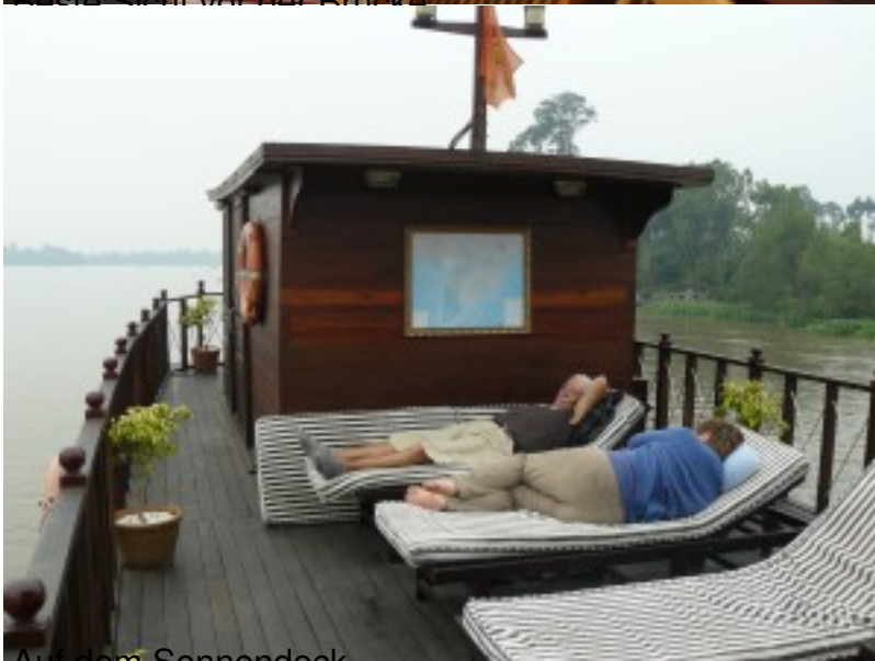
Auf dem Sonnendeck