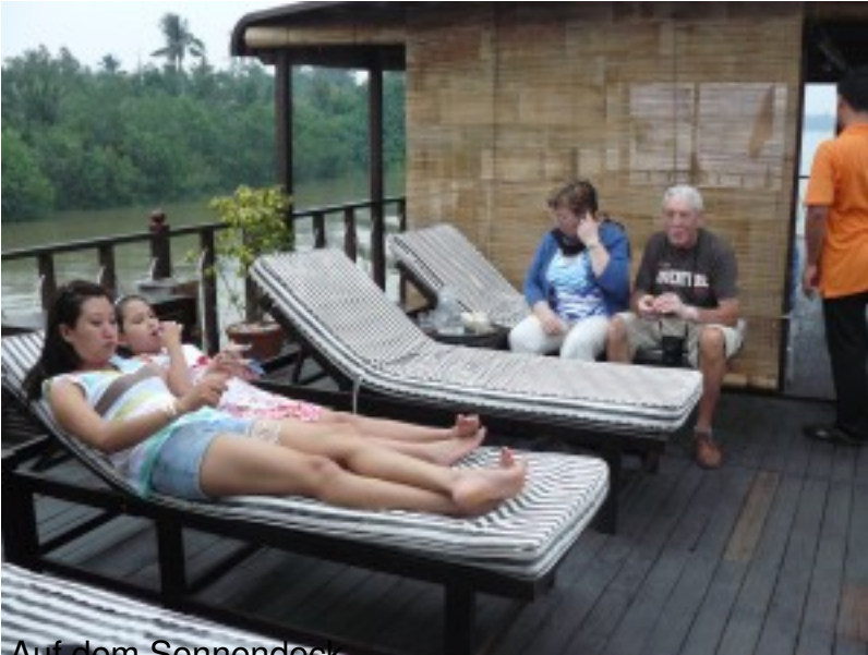
Auf dem Sonnendeck