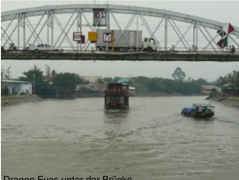
Dragon Eyes unter der Brücke