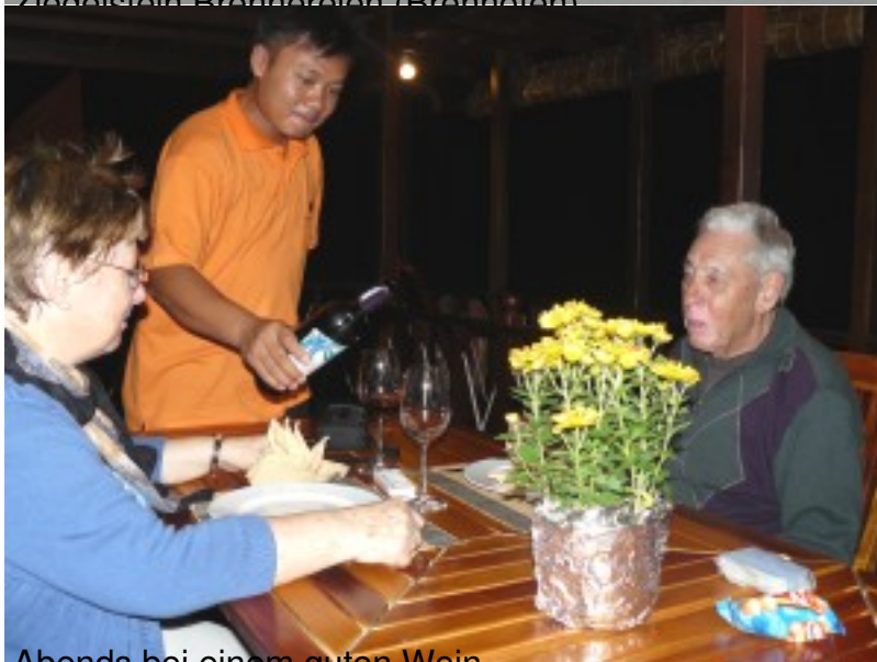
Abends bei einem guten Wein