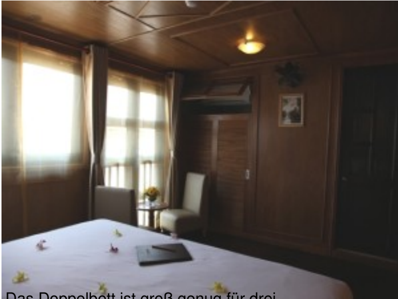
Das Doppelbett ist groß genug für drei