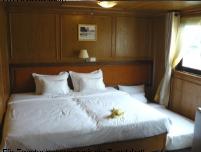
Für Tochter bekamen wir ein Zusatzbett