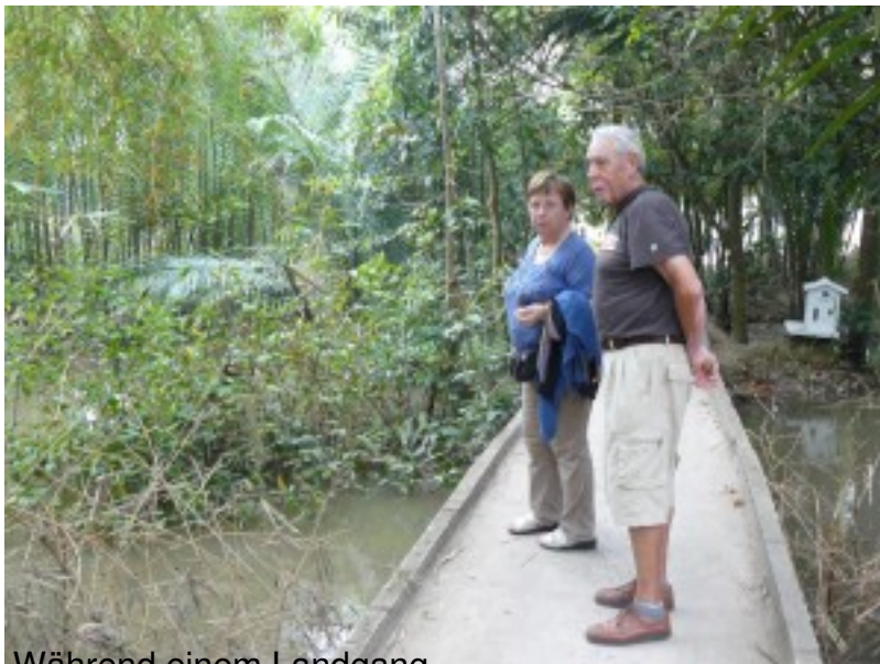
Während einem Landgang