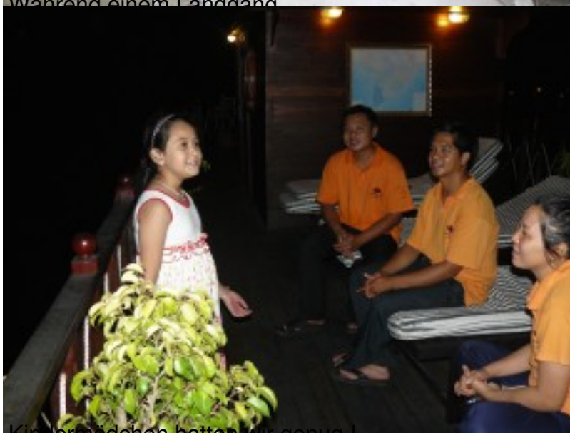
Kinder Mädchen hatten wir genuss