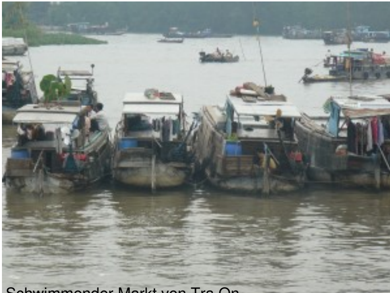
Schwimmender Markt von Tra On