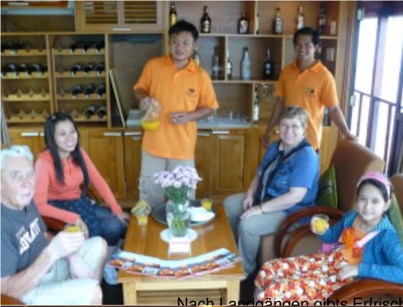
Nach Landgängen gibt's Erfrischungsdrink