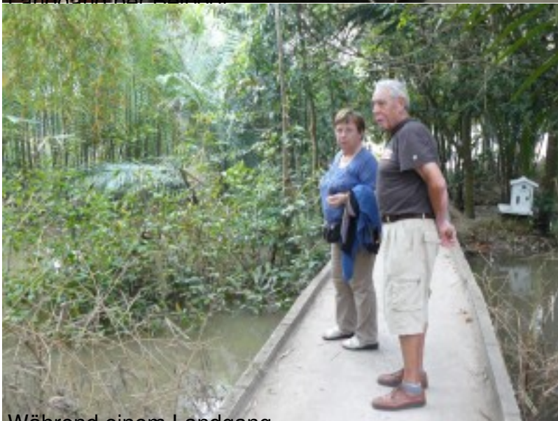
Während einem Landgang