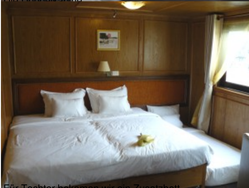
Für Tochter bekommen wir ein Zusatzbett