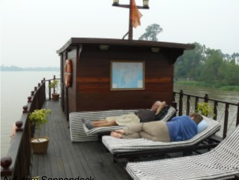
Auf dem Sonnendeck