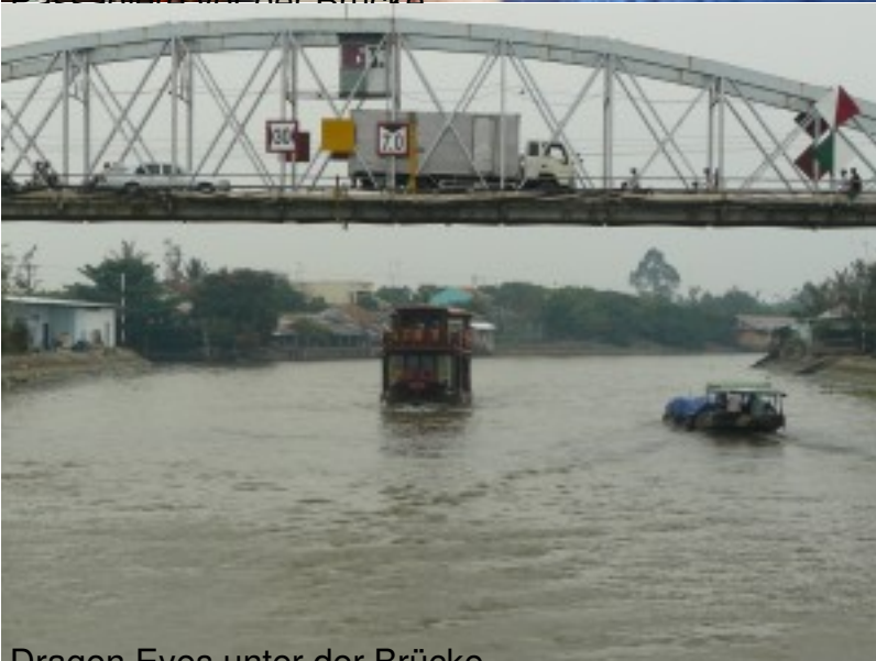
Dragon Eyes unter der Brücke