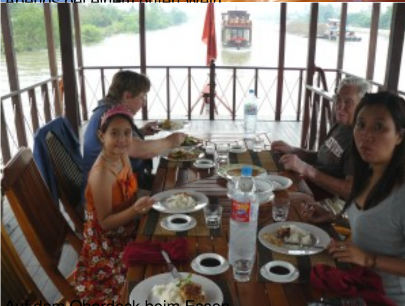
Auf dem Oberdeck beim Essen