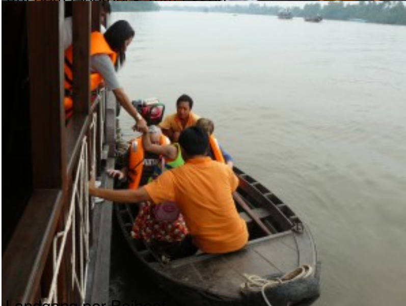
Landgang per Boot