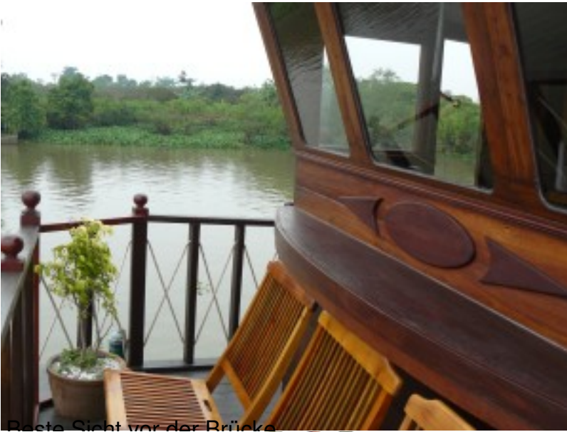
Beste Sicht vor der Brücke