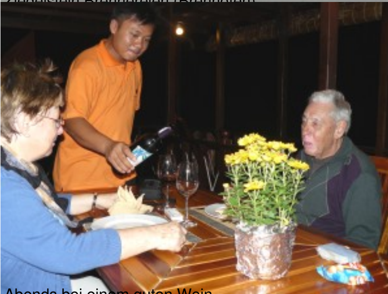
Abends bei einem guten Wein