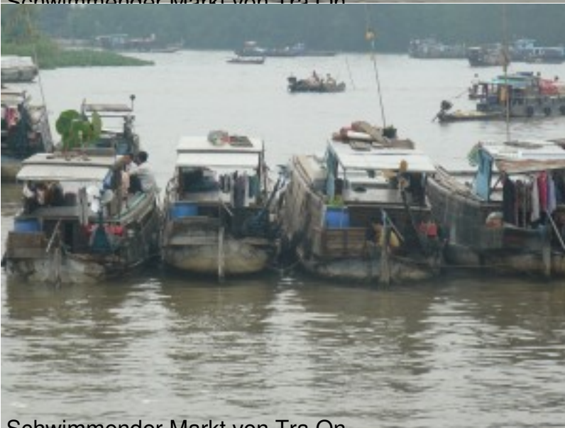
Schwimmender Markt von Tra On