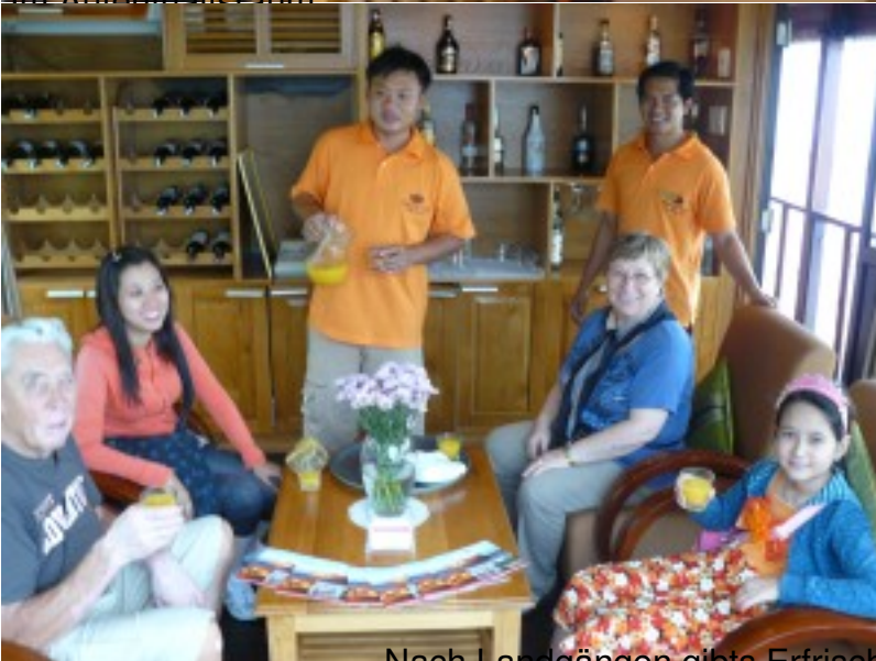
Nach Landgängen gibts Erfrischungsdrink