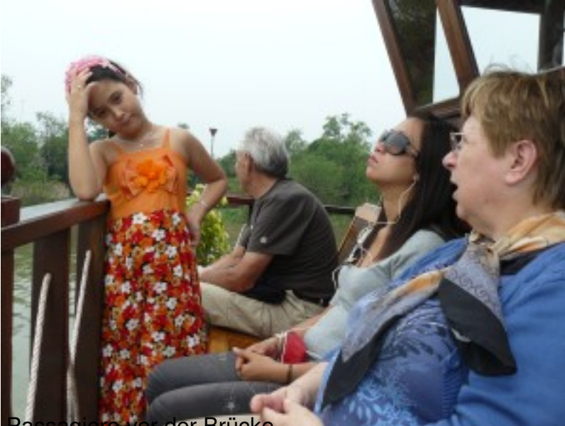
Passagiere vor der Brücke