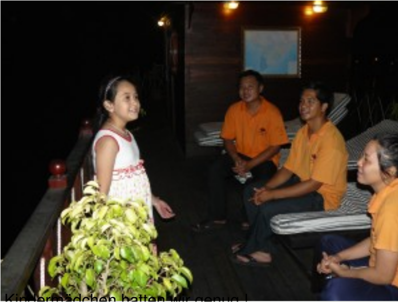
Kinder Mädchen hatten wir genug