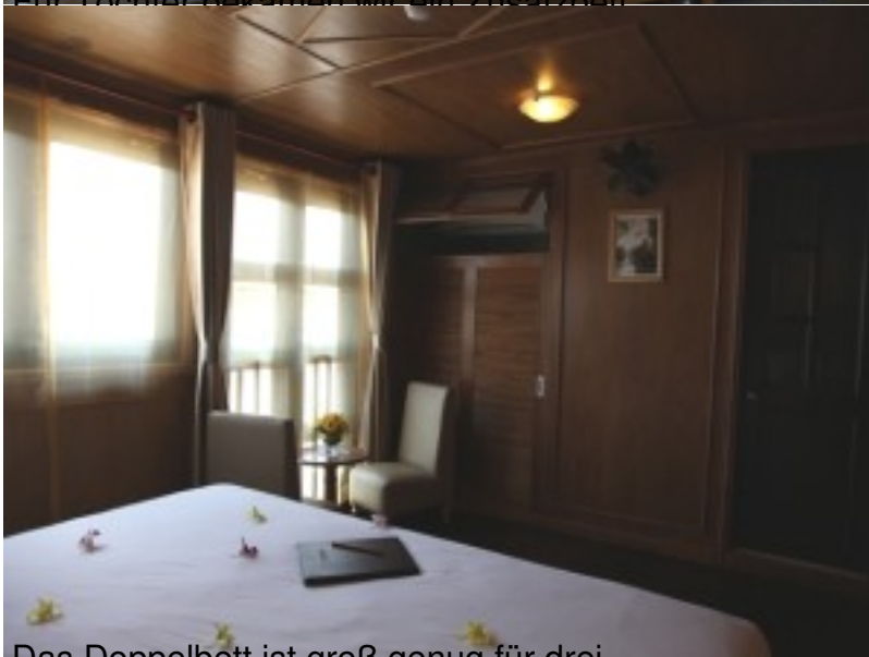
Das Doppelbett ist groß genug für drei