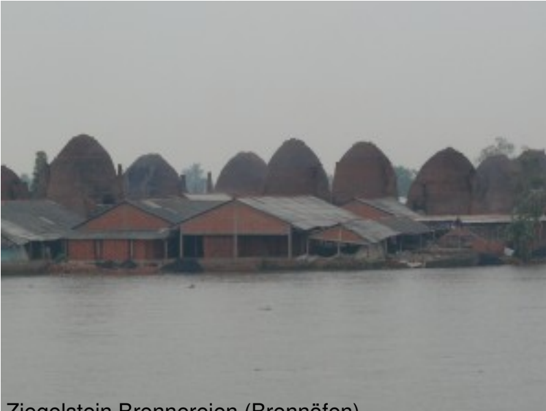
Ziegelstein Brennerien (Brennöfen)