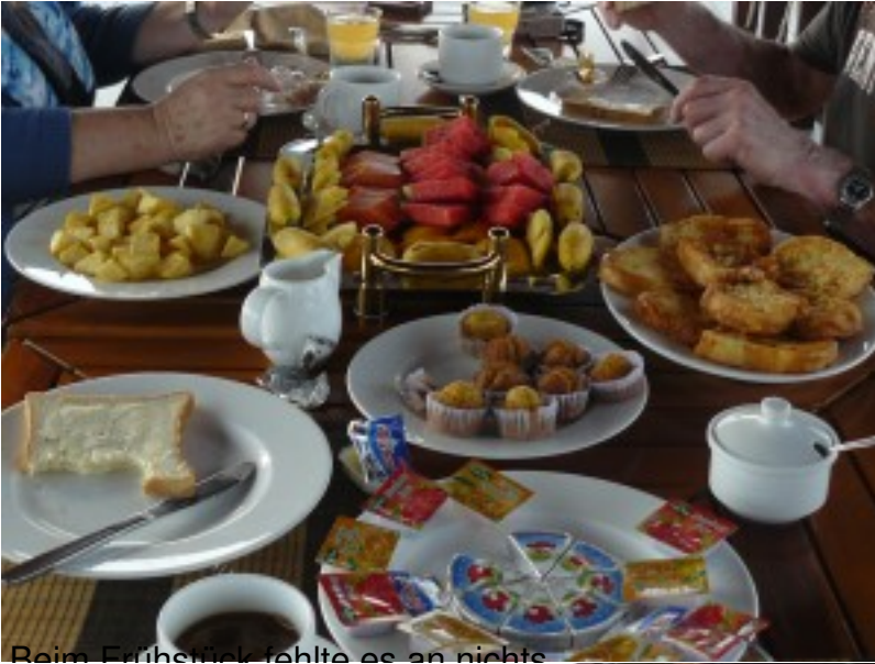
Beim Frühstück fehlte es an nichts