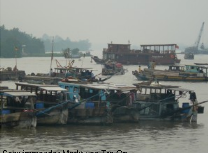
Schwimmender Markt von Tra On